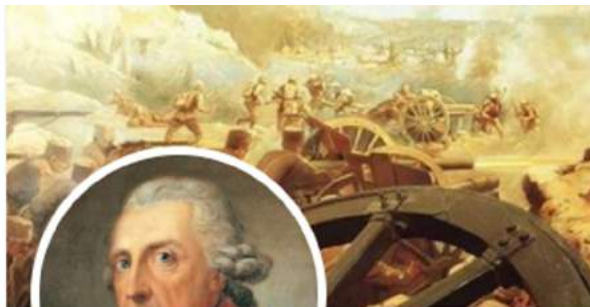
Friedrich der Grosse @derAlteFritz_

Würden Friedrich der Große und Voltaire heute noch Briefe schreiben?